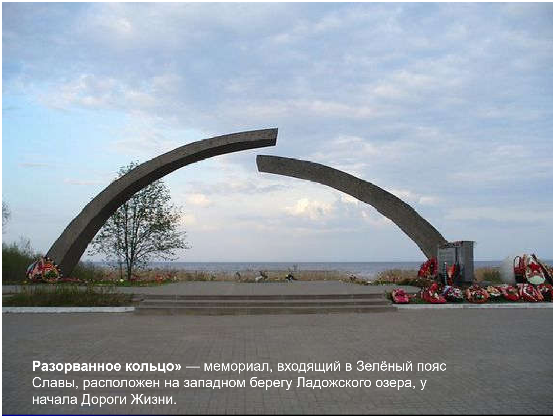
Разорванное кольцо» — мемориал, входящий в Зелёный пояс Славы, расположен на западном берегу Ладожского озера, у начала Дороги Жизни.