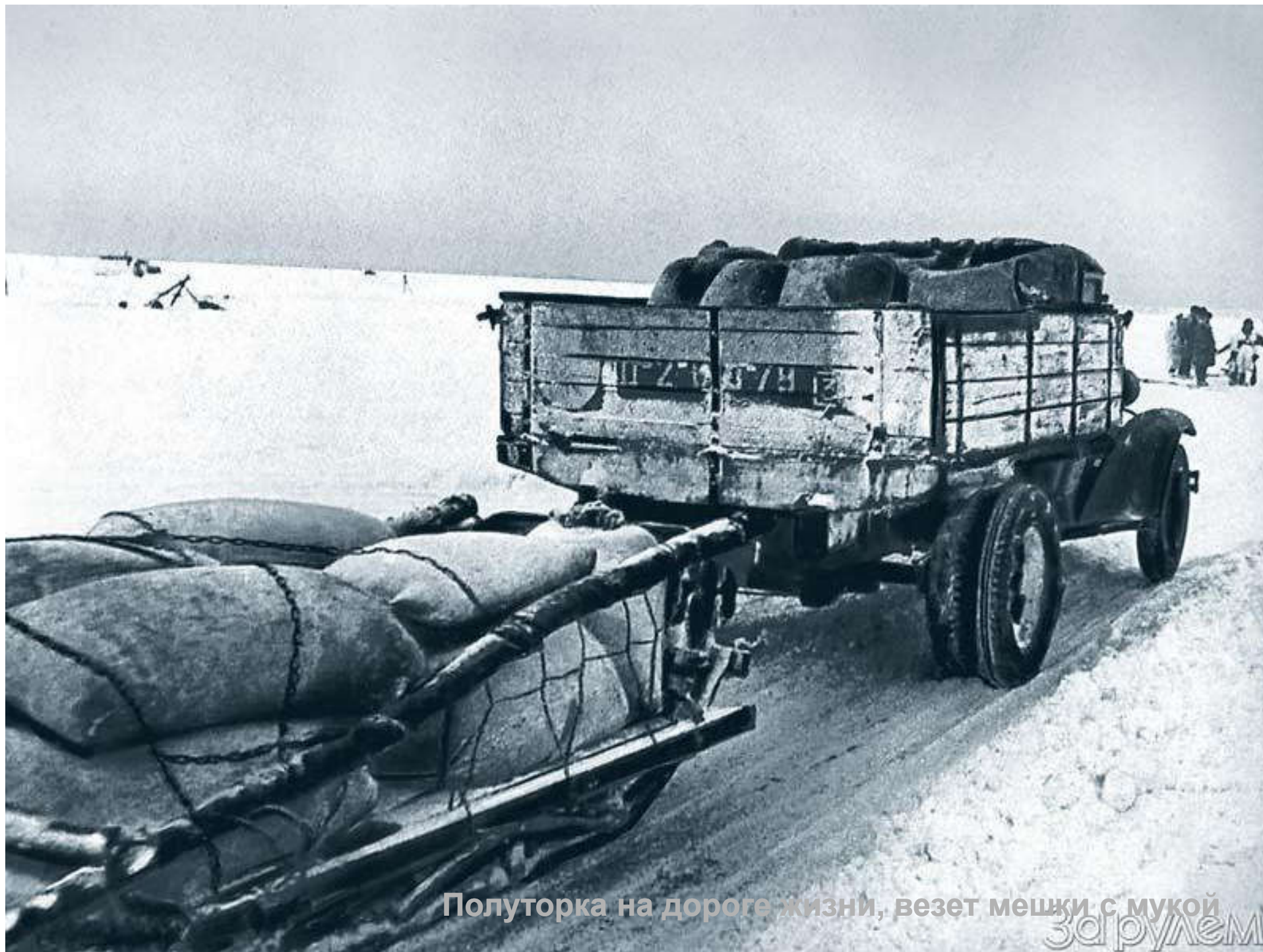
Полуторка на дороге жизни, везет мешки с мукой