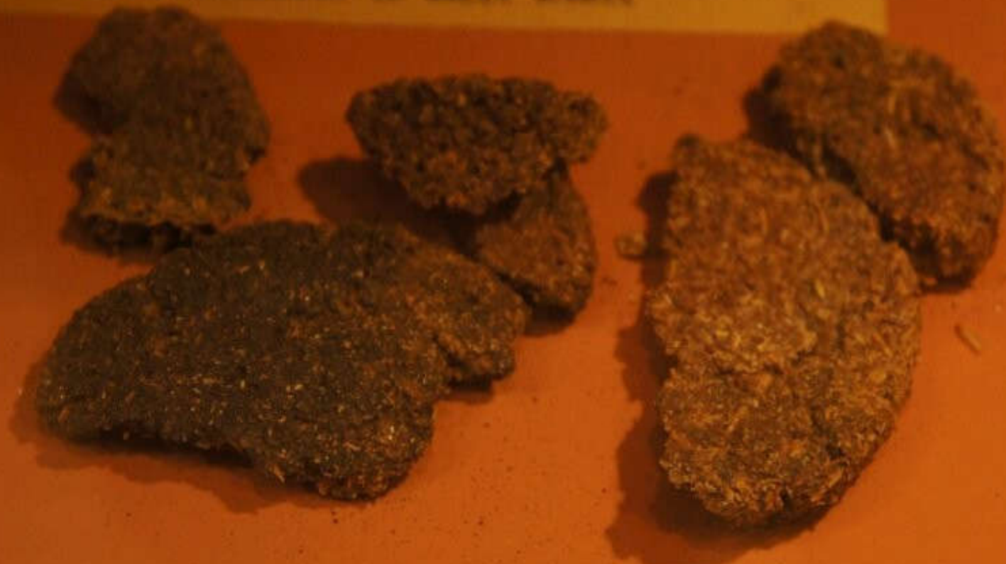
ЛЕПЕШКИ ИЗ ЛЕБЕДЫ С ОТРУБЯМИ, ПОДЖАРЕННЫЕ НА МАШИННОМ МАСЛЕ