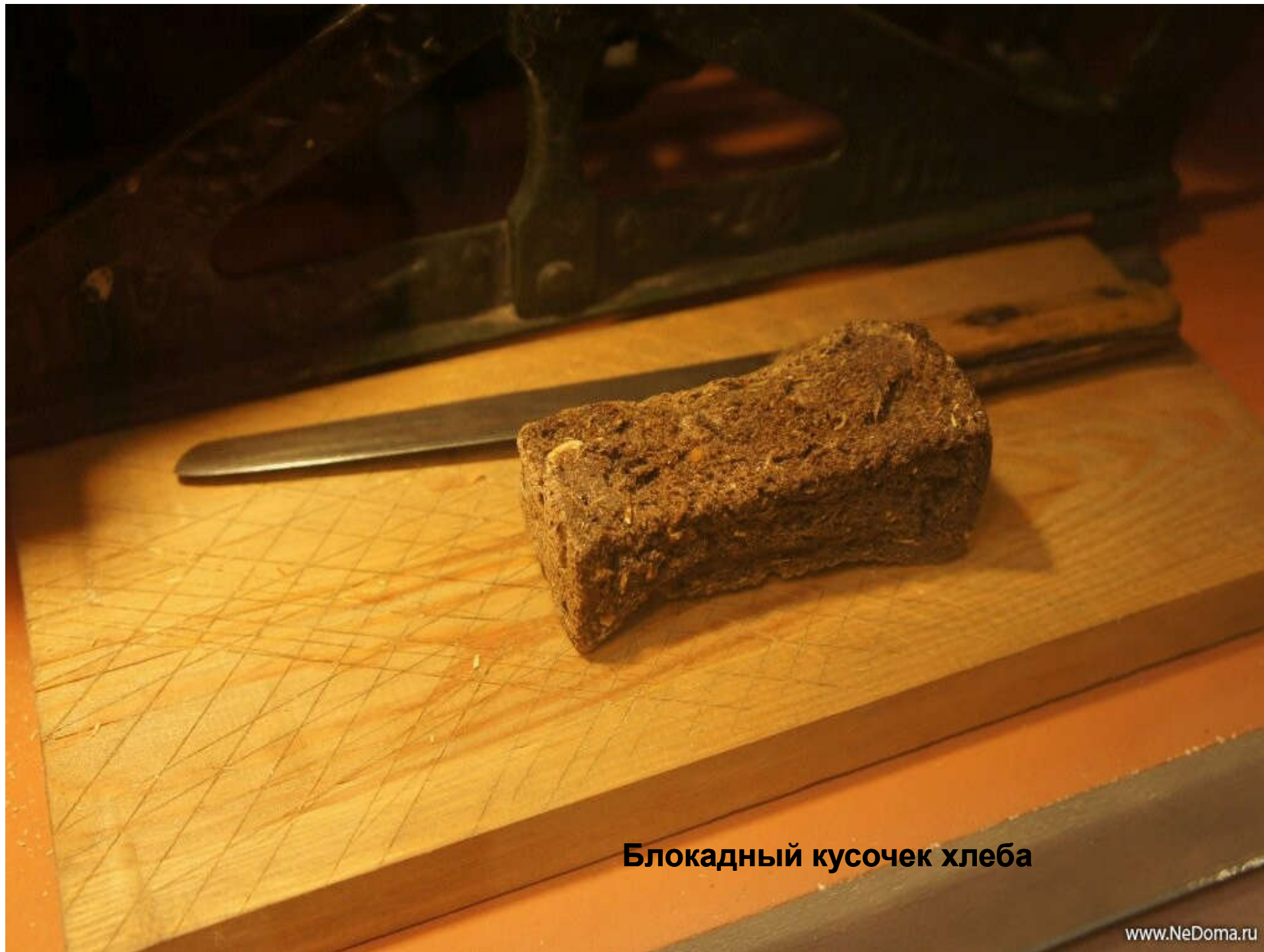
Блокадный кусочек хлеба